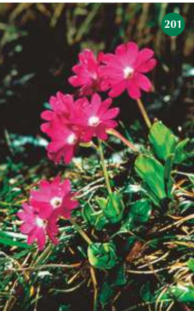
Clusius-Primel, Primula clusiana 201