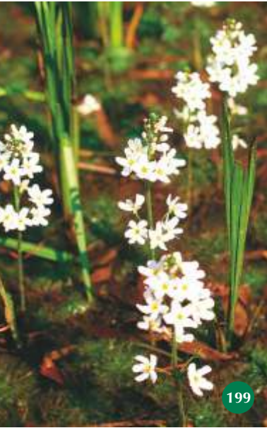
Wasserfeder, Hottonia palustris 199