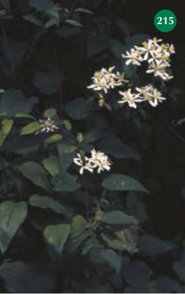
Aufrecht-Waldrebe , Clematis recta 215