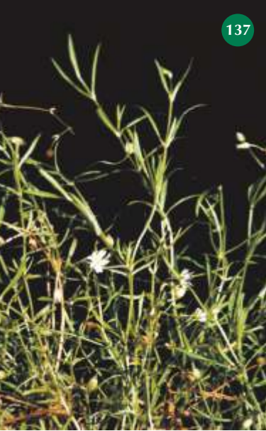
Langblatt-Sternmiere , Stellaria longifolia 137