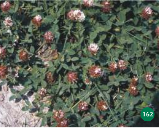
Erdbeer-Klee , Trifolium fragiferum 162